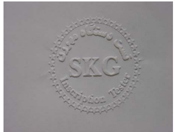
قرار گیری قالب مهر Die location